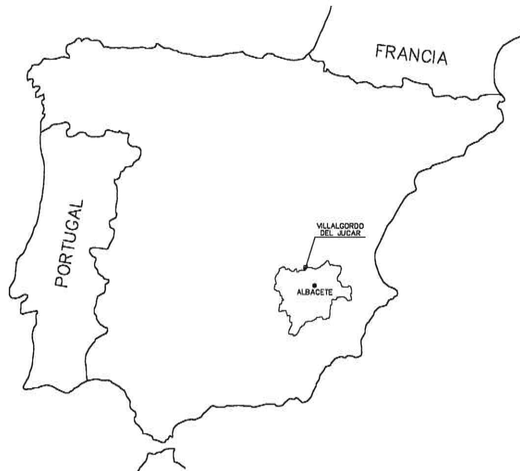
LOCALIZACION SIN ESCALA